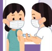
清響はユニットで接種しました